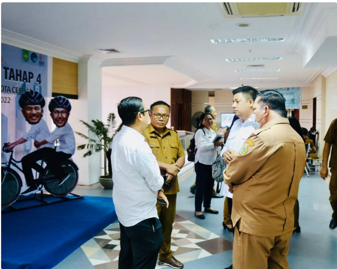
Pertemuan tersebut diawali dengan pemutaran Audio Visual peluang Investasi di